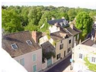
Village de Boissettes - Rue Brouard