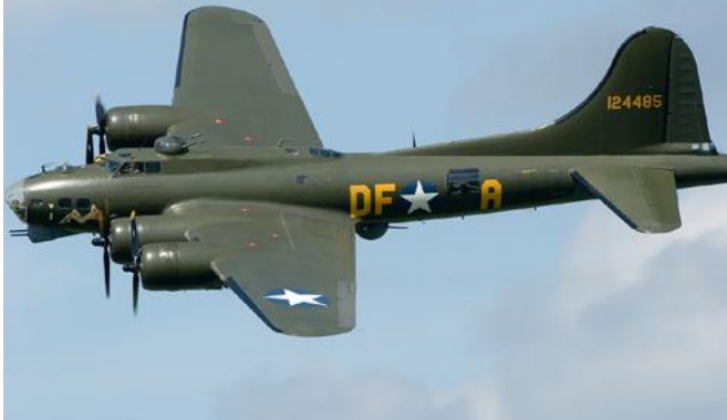
B-17 SALLY B

Le Sally B est l'un des derniers construits par l'usine Lockheed-Vega de Burbank en Californie. Accepté par l'armée de l'air américaine le 19 juin 1945, il arrive trop tard pour servir en temps de guerre et est envoyé à Nashville pour être modifié. Converti à des fins d'entraînement, il est basé à Wright Field, Ohio, à partir de novembre 1945 et sert de véhicule de recherche. Utilisé en France par l'Institut Géographique National (IGN) pour des travaux d'enquête et de cartographie à partir de 1954, le B-17 784 est transféré au Royaume-Uni dans les années 70. Le « Sally B » est désormais le dernier B-17 en état de vol en Europe.