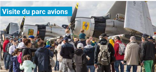
Visite du parc avions

Pendant la matinée, approchez au plus près les avions qui participent au spectacle aérien de l'après-midi. Conférenciers et équipages seront là pour vous raconter l'histoire de leurs appareils et répondre à vos questions.