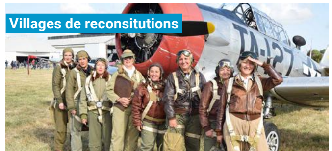
Villages de reconstitutions

Sensations fortes garanties avec les expériences d'immersion en vol à bord d'avions historiques et modernes.