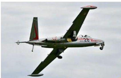
FOUGA CM.175 ZÉPHYR