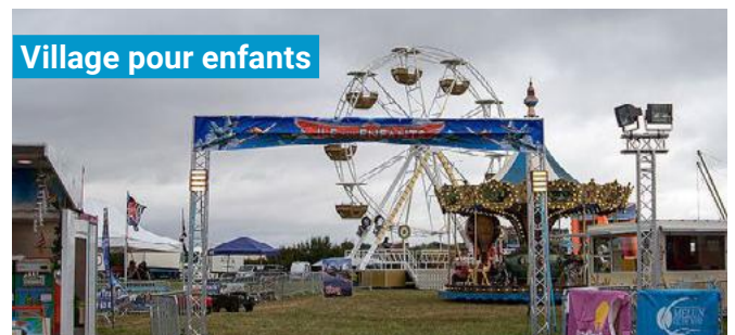
Village pour enfants

Une centaine d'exposants et des milliers de produits : sociétés et associations aéronautiques, libraires, illustrateurs, photographes, tenues de vol, vêtements, accessoires, objets de décoration, maquettes, etc.