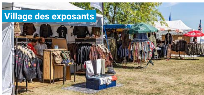
Village des exposants

Transportez-vous dans le temps en déambulant dans les scènes historiques des années 40 avec personnages en costumes et véhicules d'époque .