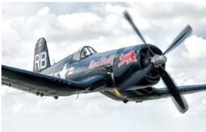
F4U-4 CORSAIR FLYING BULLS